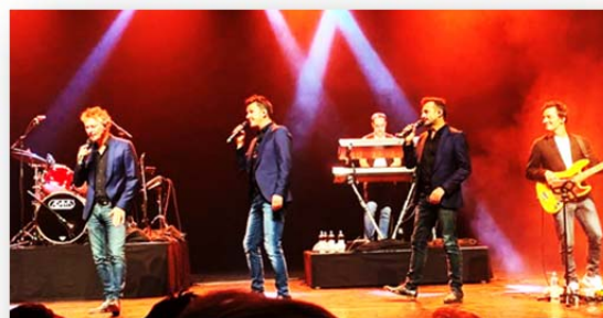
In oktober 2019 kon dit nog: na een geslaagd muzikaal optreden in de theaterzaal, nog een drankje en een goede babbel in de feestzaal

Samen met inwoners gaan we aan de slag, stellen een programma op en dragen zo bij tot dynamische wijken. Je kent ons zeker van het levendige buurtcentrum Itterbeek Idee, we helpen bij de logistiek van het kinderdorp en de wereldmarkt van het Vijverfestival en ondersteunen 'Ontmoet elkaar op den trottoir' in 24 wijken. Nieuwe inwoners ontmoeten kan je ook zelf doen door een buurtfeest te organiseren. Denk er dan aan om je buurtfeestsubsidie bij dit team aan te vragen.